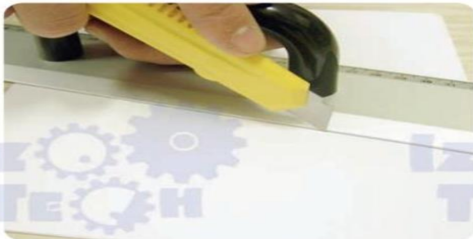
Zareza za pregib

Zarezo napravimo v lepenko ali karton z lepenkarskim nožem. Vrez naj bo globok približno 1/3 debeline gradiva. Tudi v tem primeru ostane zarez za pregib.