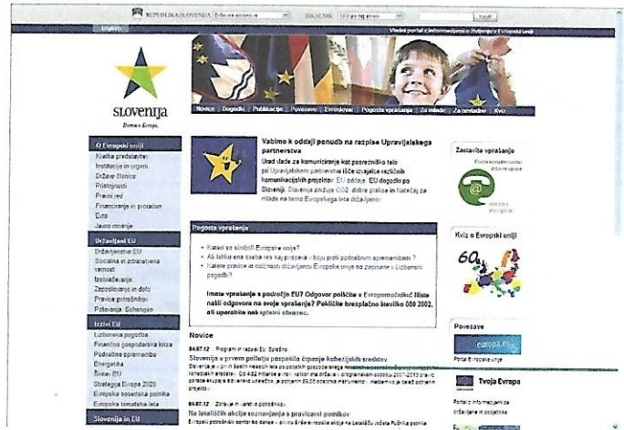
Vir: Kratka predstavitev EU, Urad Vlade RS za komuniciranje, http://www.arhiv.evropa.ukom.gov.si/si/kratka-predstavitev/index.html , dostopno 18. 9. 2017.

č. V Sloveniji plačujemo z evri . V katerih sosednjih državah tudi plačujejo z njimi?