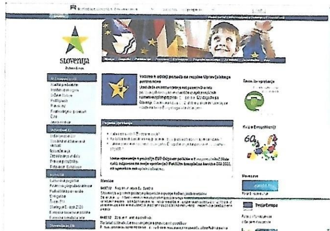
Vir: Kratka predstavitev EU, Urad Vlade RS za komuniciranje, http://www.arhiv.evropa.ukom.gov.si/si/kratka-predstavitev/index.html , dostopno 18. 9. 2017.